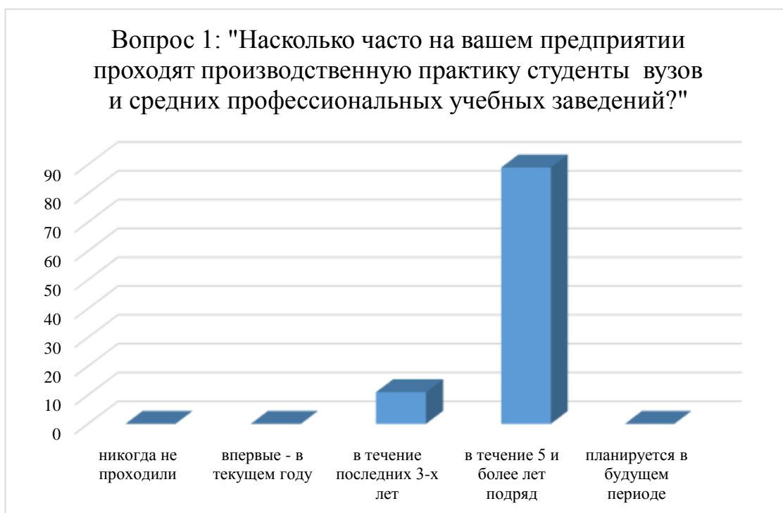
Рисунок 1 – Диаграмма результатов ответа выпускников на вопрос №1 анкеты

При ответе на вопрос «От влияния каких факторов, на Ваш взгляд, зависит уровень профессиональной подготовки выпускников?», 100 % опрошенных отметили глубокое знание профессиональных дисциплин, уровень организации производственной практики в период обучения, 92% добавили к этим факторам общий уровень теоретических знаний и освоение профильной рабочей профессии в рамках обучения по специальности.