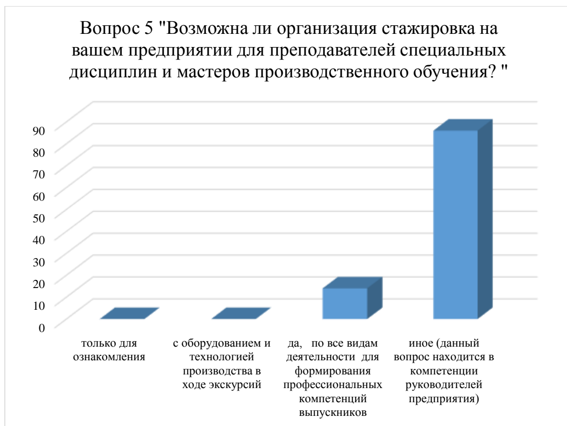
Рисунок 3– Диаграмма результатов ответа выпускников на вопрос №5 анкеты