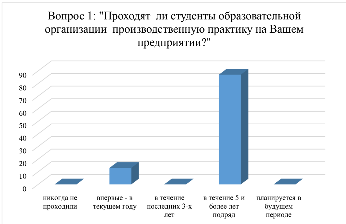
Рисунок 1 – Диаграмма результатов ответа выпускников на вопрос №1 анкеты