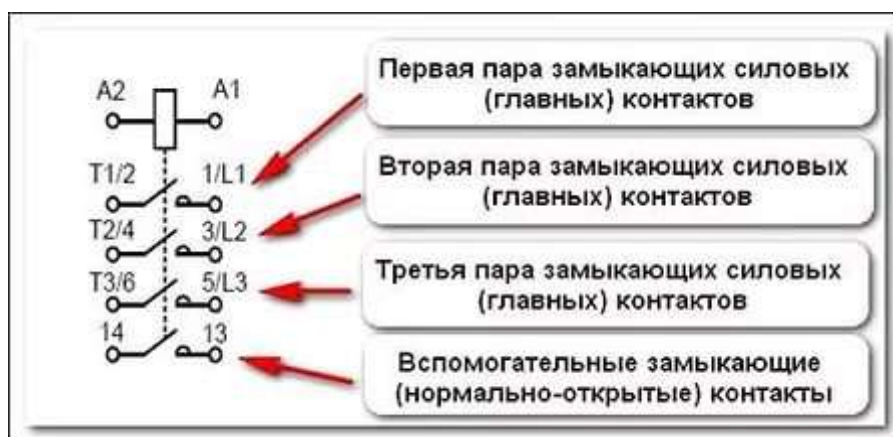
Схема магнитного пускателя ПМЛ-1100