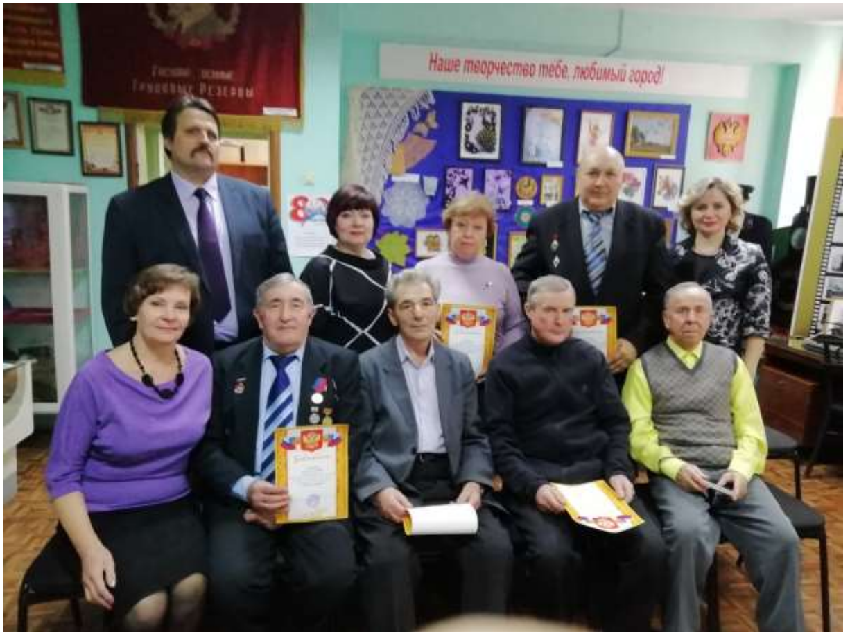
Фото на память. 29.11.2018г.