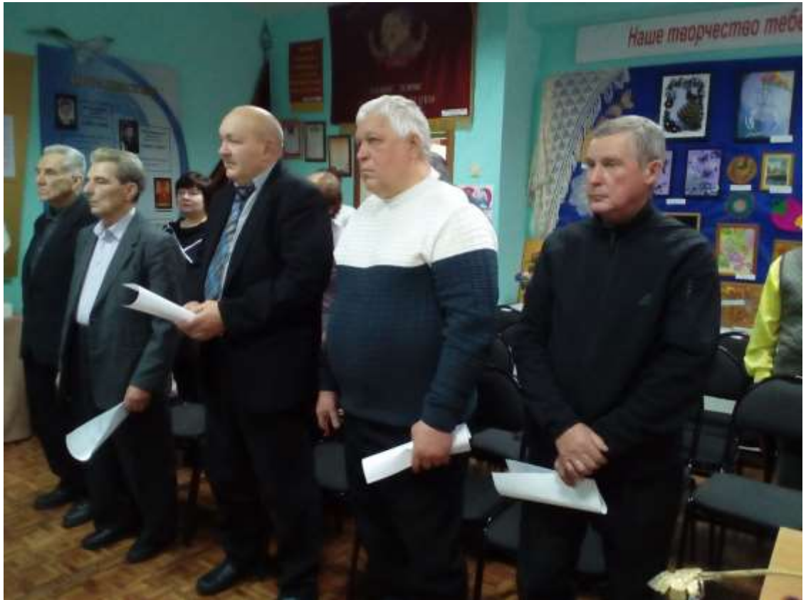
Открытие мероприятия в музее. Гости слушают гимн Белово.